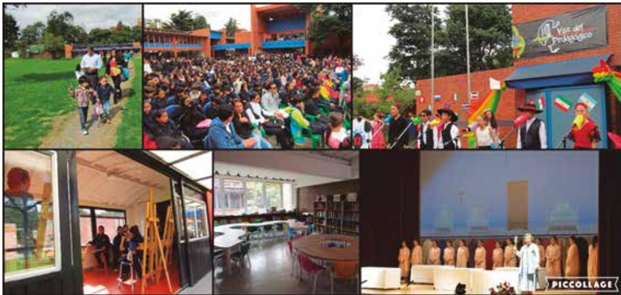
La formación integral de nuestros estudiantes, es el reflejo de la producción académica, artística y lúdica en todos los niveles de formación.